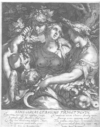
Jan Saenredam, гравюра, 26 x 18,2 см. (по рисунка на Abraham Bloemaert) Колекция „Холандска живопис“, Пражка национална галерия